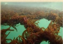
海中の海苔網の様子

大阪湾は栄養豊富で潮の流れが穏やかなため、海苔養殖に向けた漁場です。かつて大阪府では70もの養殖業者が存在したそうですが今は阪南市に3軒ある海苔業者しか残っていません。大阪湾の恵みを受けた風味豊かで柔らかい海苔は、ふわっと広がる磯の香りが特徴です。ぜひ一度食べてみてくださいね。