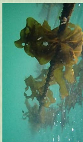
水中で育つワカメ

大阪湾で育つワカメは潮の流れが穏やかであることから葉がやわらかく、さっと湯にくぐらせるときれいな緑色になるのが特徴です。ぜひ一度食べてみてくださいね。